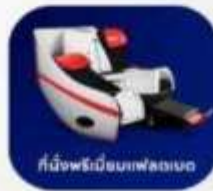
ที่นั่งพรีเมียมฟล็กซเบด