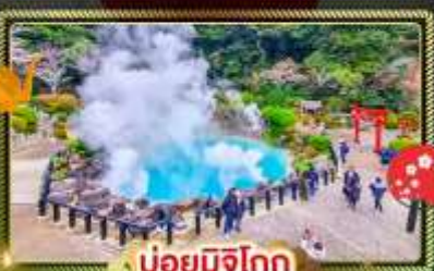
บ่อยู่มิชิโกะ