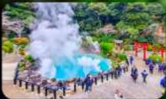
บ่อยูมิจิโตะ