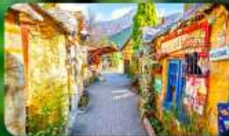
หมู่บ้านยูฟุอิน