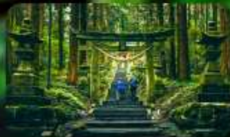
ศาลเจ้าคามิซึกิมิ