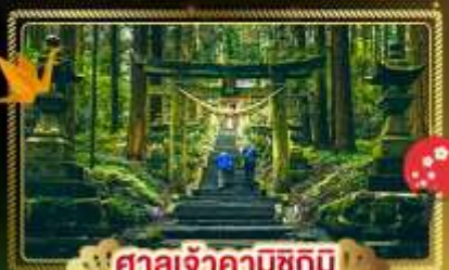
ศาลเจ้าคามิซึกิมิ