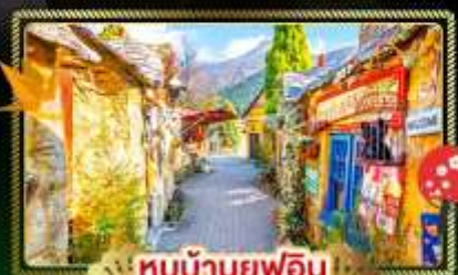
หมู่บ้านยุฟุอิน