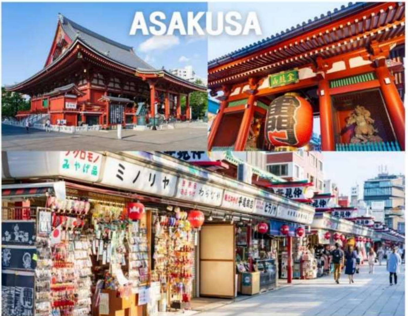
PJPNRT27-SL TOKYO FUJI PINK MOSS FULL DAY 5D3N

นำท่านเดินทางสู่ “มหานครโตเกียว” เพื่อนมัสการเจ้าแม่กวนอิมทองคำ ณ “วัดอาซากุสะ” วัดที่ได้ชื่อว่าเป็นวัดที่มีความศักดิ์สิทธิ์ และได้รับความเคารพนับถือมากที่สุดแห่งหนึ่งในกรุงโตเกียว ภายในประดิษฐานองค์เจ้าแม่กวนอิมทองคำที่ศักดิ์สิทธิ์ ซึ่งมักจะมีผู้คนมาราบไหว้ขอพรเพื่อความเป็นสิริมงคลตลอดทั้งปี ประกอบกับภายในวัดยังเป็นที่ตั้งของโคมไฟยักษ์ที่มีขนาดใหญ่ที่สุดในโลกด้วยความสูง 4.5 เมตร ซึ่งแขวนห้อยอยู่ ณ ประตูทางเข้าที่อยู่ด้านหน้าสุดของวัด ที่มีชื่อว่า “ประตูพิฆาตารณ” ถนนนากามิเซะ หรือที่หลายๆคนรู้จักกันว่า “ถนนช้อปปิ้งนากามิเซะ” เป็นทางเดินทอดยาวจากถนนหลักที่ร่ว่งเข้าสู่พื้นที่ภายในของวัดนั้นแหละค่ะ เนื่องจากวัดอาซากุสะเป็นวัดยอดนิยมของโตเกียวจึงทำให้ถนนเส้นนี้เป็นถนนเส้นที่คึกคักเกือบ