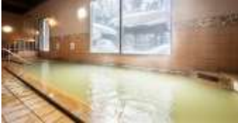
หลังอาหารค่ำ ให้ทุกท่านผ่อนคลายกับการแช่น้ำแร่ธรรมชาติสไตส์ญี่ปุ่น