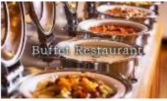
อาหารเย็น : อาหาร บุฟเฟต์ สไตส์ญี่ปุ่น