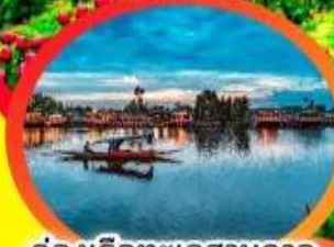
ล่องเรือทะเลสาบดาล