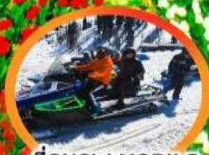
ขี่ SNOW MOBILE