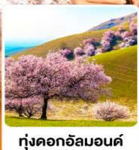
ทุ่งดอกอัลมอนต์